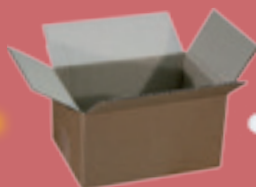
(Benne à carton)

Les gros cartons, les polystyrènes d'emballages et les guirlandes électriques sont à apporter en déchèterie.