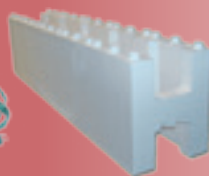
(Benne tout venant)